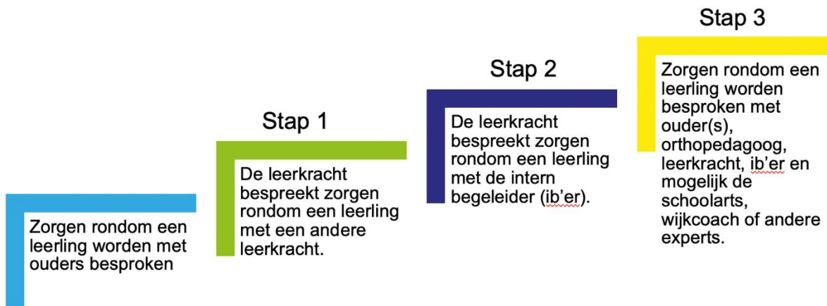
Figuur 8: zorgstructuur Lonnekerschool

Soms zijn de zorgen rondom de ontwikkeling dermate groot of complex, dat school externe ondersteuning nodig heeft. Het kan ook zijn dat we op school niet de noodzakelijke kennis of middelen hebben om een leerling verder te helpen. In dat geval kunnen wij een beroep doen op de expertise van een vast team van ondersteuners. Aan onze school zijn een orthopedagoog, een wijkcoach, een schoolverpleegkundige en een schoolarts verbonden. Dit is stap 3 in onze zorgstructuur. Wij vragen ouders bij deze stap vooraf om schriftelijke toestemming om informatie te delen. Deze ondersteuners denken mee met school over een plan van aanpak en de vervolgstappen. Daarnaast beschikken zij over de mogelijkheden om extra ondersteuning aan school te bieden of kinderen door te verwijzen naar externe hulpverleners.