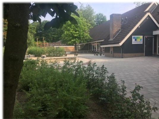
Figuur 1: Het oude schoolgebouw in 1843 Figuur 2: Huidige schoolgebouw