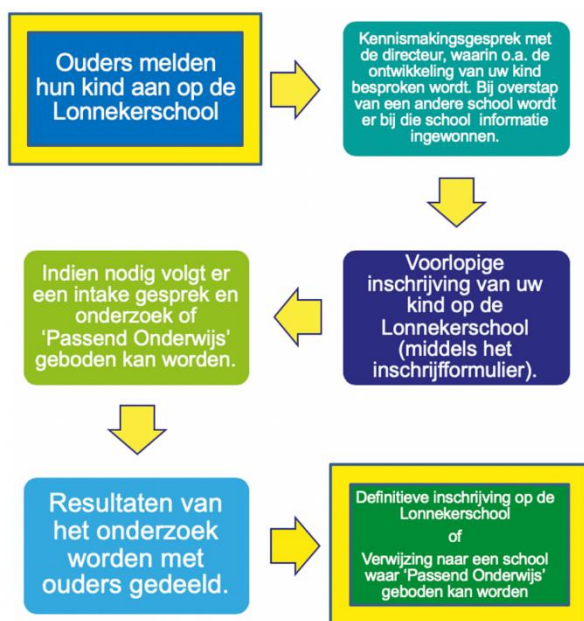
Figuur 6: verloop van aanmelding tot inschrijving

De aanmelding van nieuwe leerlingen gebeurt door ouders en/of verzorgers. Zij kunnen hiervoor een afspraak maken met de directie. Na aanmelding wordt er altijd een kennismakingsgesprek gevoerd met de directeur. In dit gesprek wordt de schoolvisie, het onderwijs en algemene informatie over de school besproken. Tevens vindt er een rondleiding plaats. Zie onderstaand schema (figuur 6) voor het verdere verloop, voordat kinderen definitief als leerlingen worden ingeschreven.