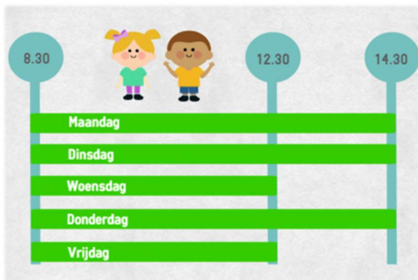
Figuur 5: Schooltijden op de Lonnekerschool

Tijdens het buitenspelen is er altijd toezicht door minimaal twee pleinwachten. De pleinwacht wordt uitgevoerd door leerkrachten, de IB'er of de directeur. Zij kunnen ondersteund worden door de conciërge en/of stagiaires.