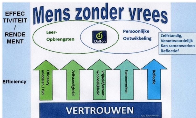
Figuur 4: Kernwaarden dalton 2

De vijf kernwaarden van het Daltononderwijs vormen een belangrijke basis voor het onderwijs op de Lonnekerschool. Hieronder kunt u lezen wat de kernwaarden voor ons onderwijs betekenen.