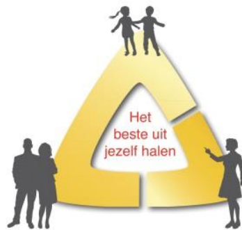
Figuur 4: De driehoek van ouderbetrokkenheid - kind - ouders - leerkracht - 4

De schoolcarrière van het kind doet er toe voor ouders en andersom zijn ouders belangrijk voor de schoolcarrière van hun kind 3 . Ouders gaan bij de inschrijving van hun kind op school een relatie aan met de school. Een goede relatie tussen school en ouders kan een belangrijke bijdrage leveren aan een positief en veilig schoolklimaat. Een kind is sterk verbonden met zijn vader en moeder. Op school bouwt het kind een relatie op met zijn leerkracht. Wanneer ouders en leerkracht een relatie hebben ontstaat er een driehoek. Bij een goede relatie tussen ouders en de leerkracht praten ouders op een positieve manier over school, helpen zij het kind met lastige situaties om te gaan en is de communicatie met de leerkracht goed en effectief. Goede verhoudingen in de driehoek zijn dus een noodzakelijke voorwaarde voor een mooie schooltijd voor het kind. Niet alleen op het gebied van rekenen en taal, maar ook op het gebied van de sfeer in de klas en de sociaal-emotionele ontwikkeling 3 .