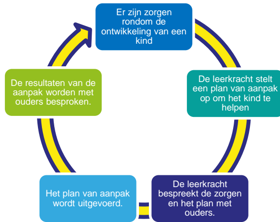
Figuur 7: cyclus als er zorgen zijn rondom de ontwikkeling van een kind.