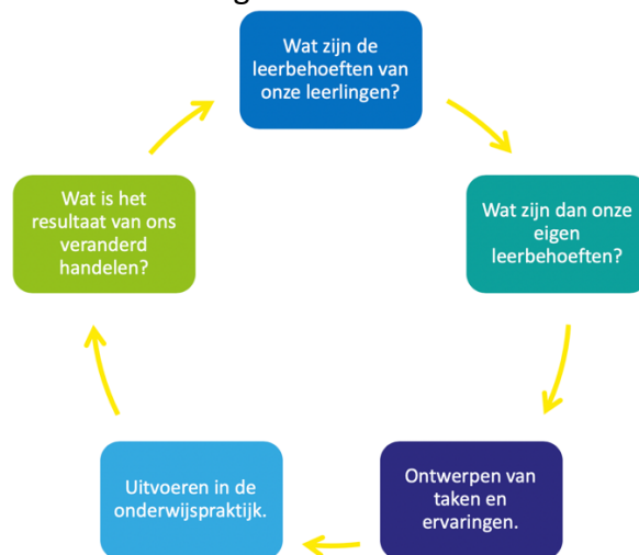
Figuur 5: De reflectieve leercyclus 5

Leerkrachten en onderwijsondersteunend personeel zijn professionals en vormen een hecht team en delen dezelfde visie. Zij willen samen een hoge kwaliteit van onderwijs realiseren. Ze zijn gemotiveerd en hebben passie voor hun vak, de leerlingen, de school en elkaar. Ze willen graag van en met elkaar leren, waarbij het geven van feedback een belangrijke rol speelt. Het team wil en durft te experimenteren met alternatieven in het onderwijsaanbod en de organisatie van het onderwijs en in te spelen op de leerbehoeften van onze leerlingen en van onszelf. In de verbetering van het onderwijsproces worden de resultaten van toetsen gebruikt om de effecten van veranderingen te meten 4 .